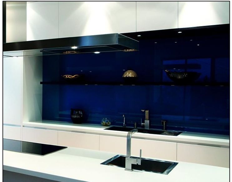
Küchenrückwand RAL 5003 (Saphirblau) lackiert

Die sehr breite Anzahl an unterschiedlichen Farben (RAL- und NCS-Farbtönen) sowie auch der hochauflösende Photoprint erfüllen jeden auch noch so spezifischen Kundenwunsch. Dank der Verwendung von umweltfreundlichem Wasserlack ohne Lösungsmittel erfüllen wir bei lackierten Gläsern den «Minergie A Eco»-Standard.