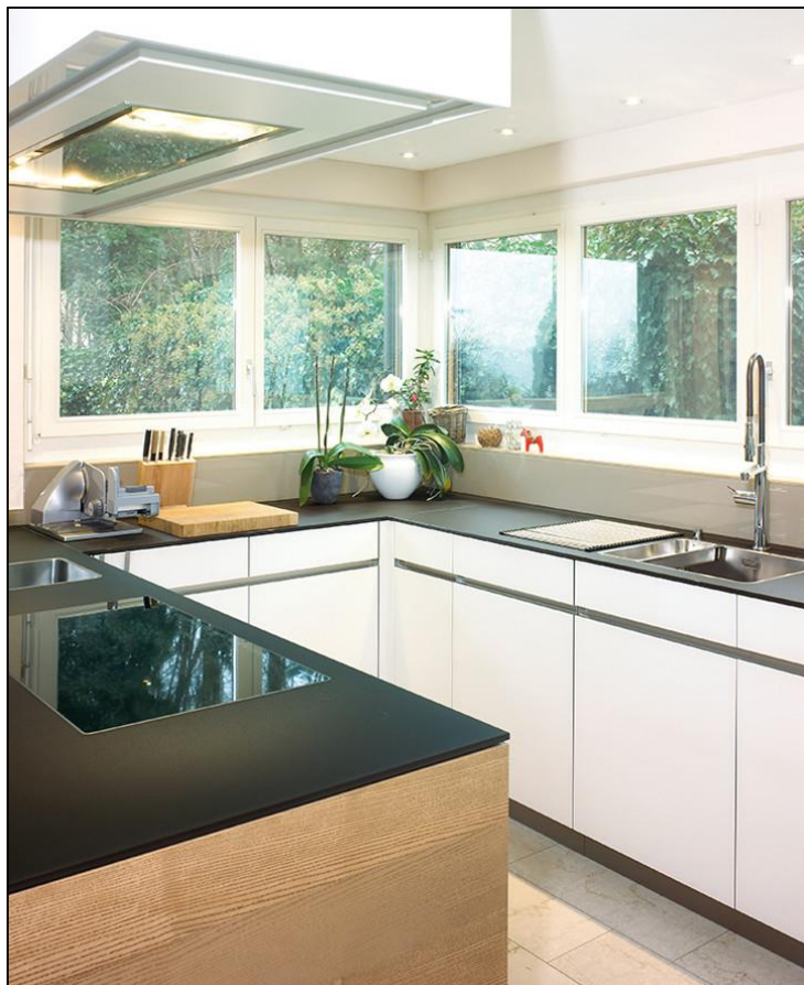
Küchenabdeckung RAL 8077 (dunkelbraun) lackiert

Mit heutiger Bearbeitungstechnik können Ausschnitte für Kochfelder und Spülbecken millimetergenau aus der Arbeitsfläche herausgeschnitten und diese so flächenbündig versenkt werden. Dank der sehr breiten Farbpalette passen Abdeckungen aus Glas in jede Küche.