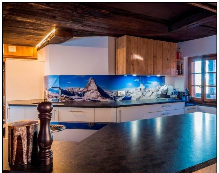
Küchenrückwand mit hochauflösendem Photoprint