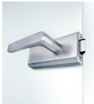
Studio Gala 2.0