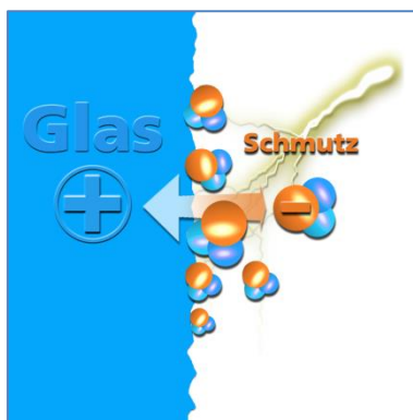
Schmutz wie beispielsweise Kalk kann Verätzungen auf der Oberfläche verursachen – die dauerhafte Barriere "Glas auf Glas" reduziert das Anlagern von Verschmutzungen.